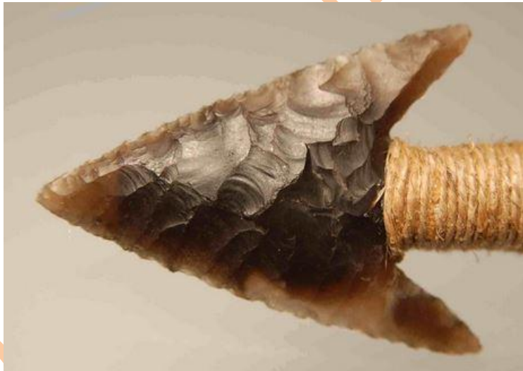
Pointe de Flèche